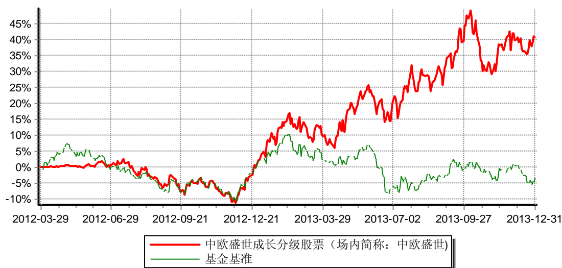
中欧盛世成长分级股票型证券投资基金 份额累计净值增长率与业绩比较基准收益率历史走势对比图 (2012年3月29日-2013年12月31日)

注：注：本基金合同生效日为2012年3月29日，建仓期为2012年3月29日至2012年9月28日，建仓期结束时各项资产配置比例符合本基金基金合同规定。