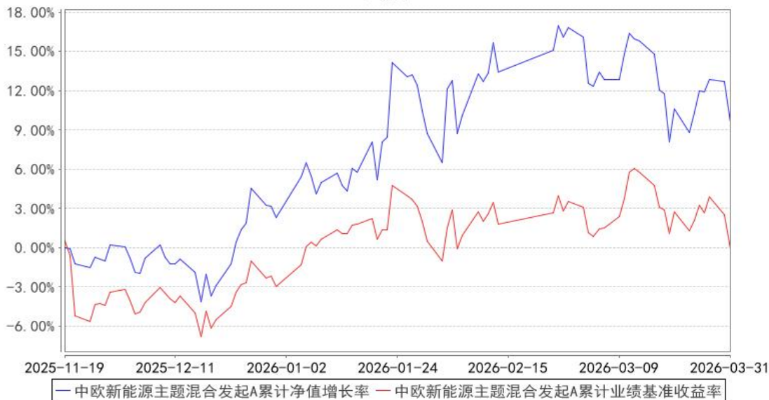
中欧新能源主题混合发起A累计净值增长率与同期业绩比较基准收益率的历史走势对比图

注：本基金基金合同生效日期为 2025 年 11 月 19 日，自基金合同生效日起到本报告期末不满一年，按基金合同的规定，本基金自基金合同生效起六个月为建仓期，建仓期结束时各项资产配置比例应当符合基金合同约定。