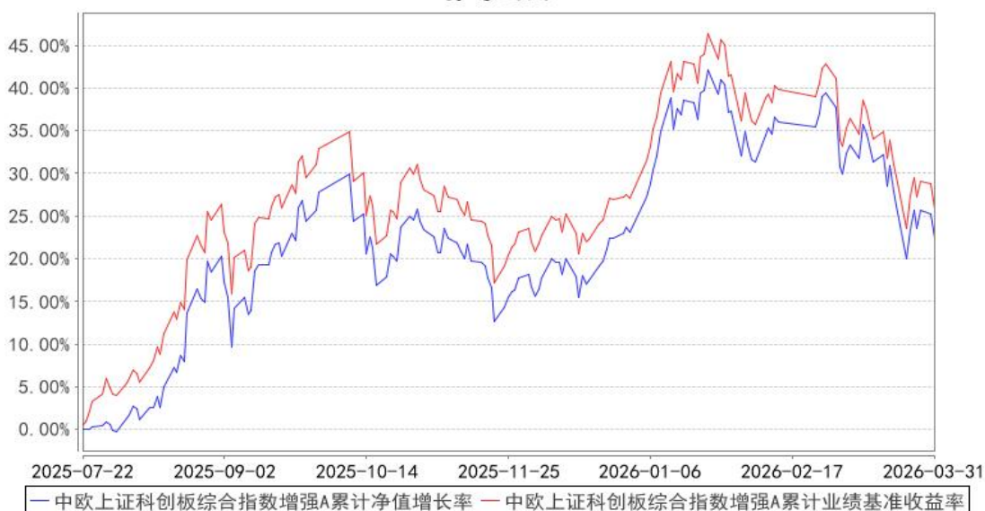
中欧上证科创板综合指数增强A累计净值增长率与同期业绩比较基准收益率的历史走势对比图

注：本基金基金合同生效日期为 2025 年 7 月 22 日，自基金合同生效日起到本报告期末不满一年，按基金合同的规定，本基金自基金合同生效起六个月为建仓期，建仓期结束时各项资产配置比例