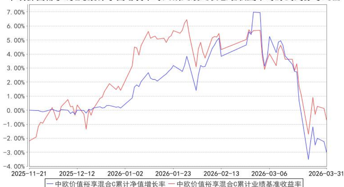
中欧价值裕享混合C累计净值增长率与同期业绩比较基准收益率的历史走势对比图

注：本基金基金合同生效日期为 2025 年 11 月 21 日，自基金合同生效日起到本报告期末不满一年，按基金合同的规定，本基金自基金合同生效起六个月为建仓期，建仓期结束时各项资产配置比例应当符合基金合同约定。