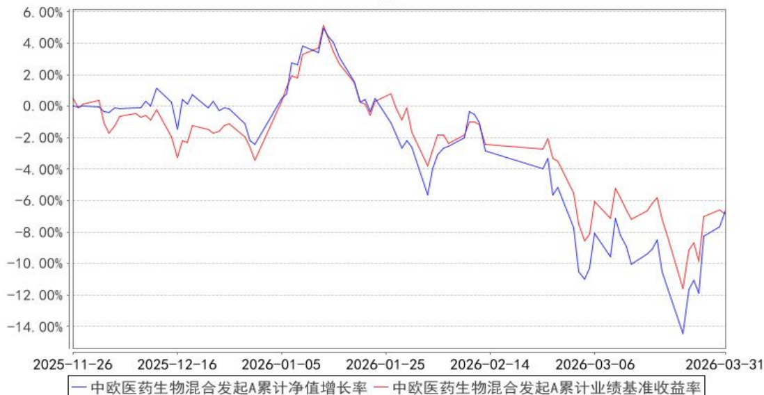
中欧医药生物混合发起A累计净值增长率与同期业绩比较基准收益率的历史走势对比图

注：本基金基金合同生效日期为 2025 年 11 月 26 日，自基金合同生效日起到本报告期末不满一年，按基金合同的规定，本基金自基金合同生效起六个月为建仓期，建仓期结束时各项资产配置比例应当符合基金合同约定。