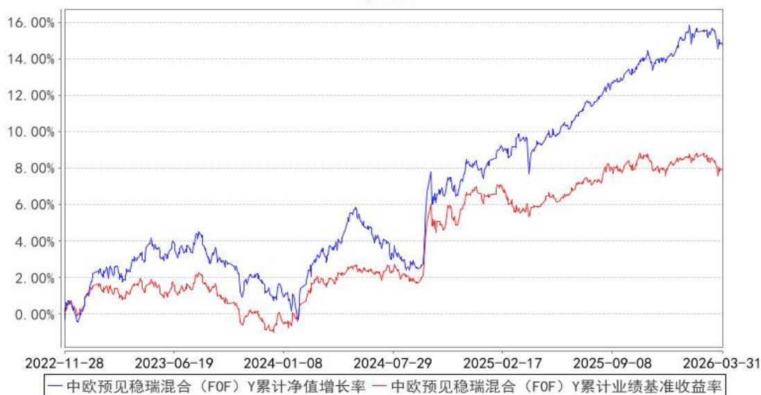
中欧预见稳瑞混合（FOF）Y累计净值增长率与同期业绩比较基准收益率的历史走势对比图

注：本基金于2022年11月16日新增Y类份额，图示日期为2022年11月28日至2026年03月31日。