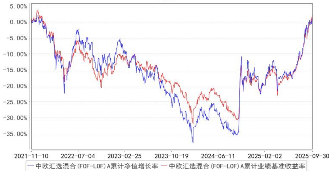
中欧汇选混合 (FOF-LOF) A 累计净值增长率与同期业绩比较基准收益率的历史走势对比图

注：2023 年 5 月 5 日起组合业绩比较基准变更为中证偏股型基金指数收益率×80%+银行活期存款利率(税后)×20%。