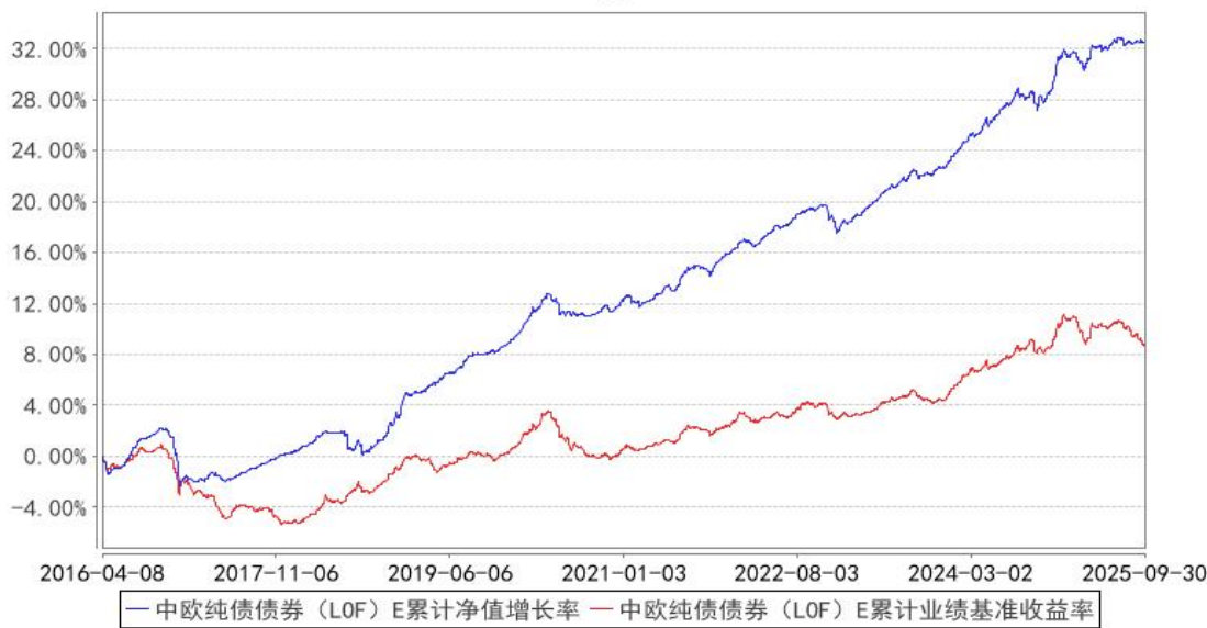
中欧纯债债券（LOF）E 累计净值增长率与同期业绩比较基准收益率的历史走势对比图

注：自 2016 年 4 月 6 日起，本基金新增 E 类份额，图示日期为 2016 年 4 月 8 日至 2025 年 09 月 30 日。