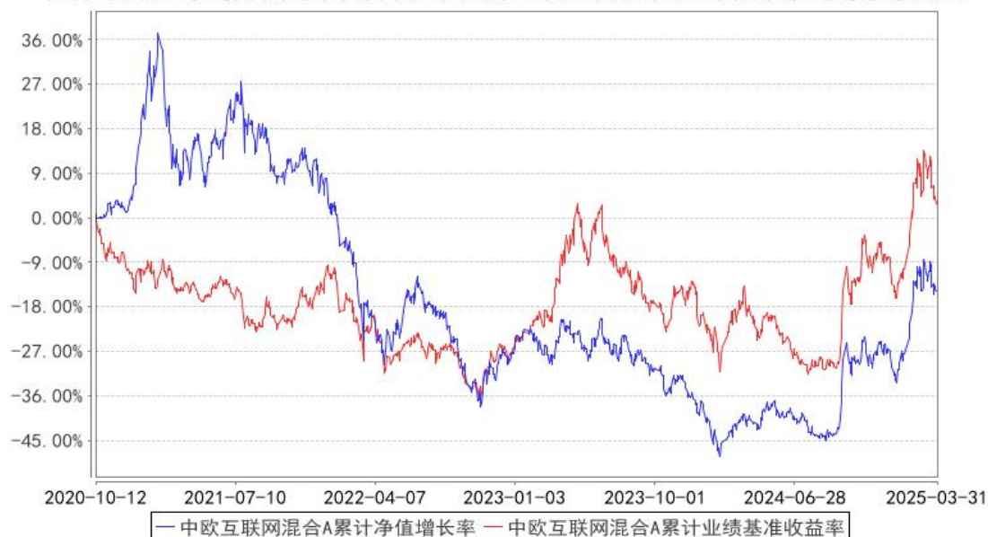
中欧互联网混合A累计净值增长率与同期业绩比较基准收益率的历史走势对比图

注：2024 年 9 月 30 日起，本基金业绩比较基准变更为中证沪港深互联网指数*85%+银行活期存款利率（税后）*15%。