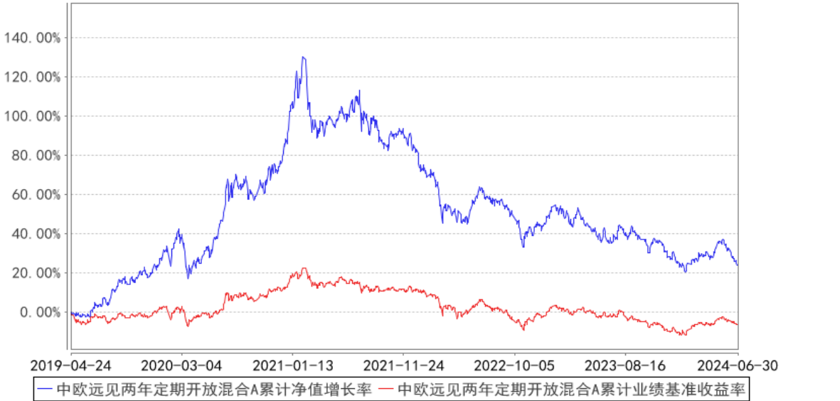
中欧远见两年定期开放混合A累计净值增长率与同期业绩比较基准收益率的历史走势对比图

注：本基金业绩比较基准为：沪深 300 指数收益率*50%+中债综合指数收益率*40%+恒生指数收益率*10%。比较基准每个交易日进行一次再平衡，每个交易日在加入损益后根据设定的权重比例进行大类资产之间的再平衡，使大类资产比例保持恒定。