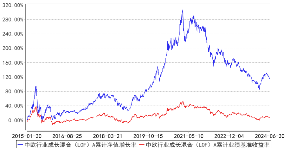
中欧行业成长混合 (LOF) A 累计净值增长率与同期业绩比较基准收益率的历史走势对比图