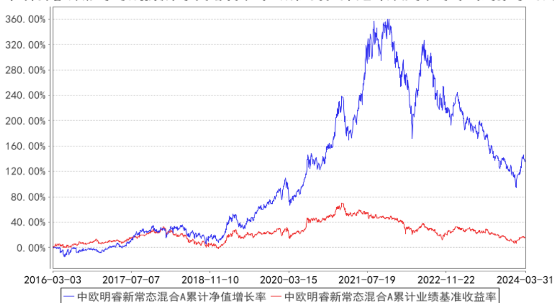
中欧明睿新常态混合A累计净值增长率与同期业绩比较基准收益率的历史走势对比图

注：2021年9月8日起组合业绩比较基准变更为沪深300指数收益率*60%+中证港股通综合指数(人民币)收益率*20%+中债综合指数收益率*20%。