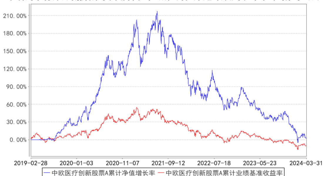
中欧医疗创新股票A累计净值增长率与同期业绩比较基准收益率的历史走势对比图