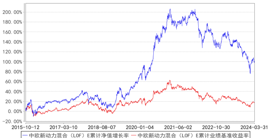
中欧新动力混合（LOF）E 累计净值增长率与同期业绩比较基准收益率的历史走势对比图

注：自 2015 年 10 月 8 日起，本基金增加 E 类份额。图示日期为 2015 年 10 月 12 日至 2024 年 03 月 31 日。