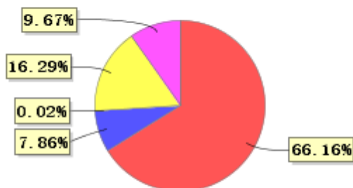
投资组合资产配置图表(2023年3月31日)

● 固定收益投资 ● 买入返售金融资产 ● 其他资产 ● 权益投资 ● 银行存款和结算备付金合计