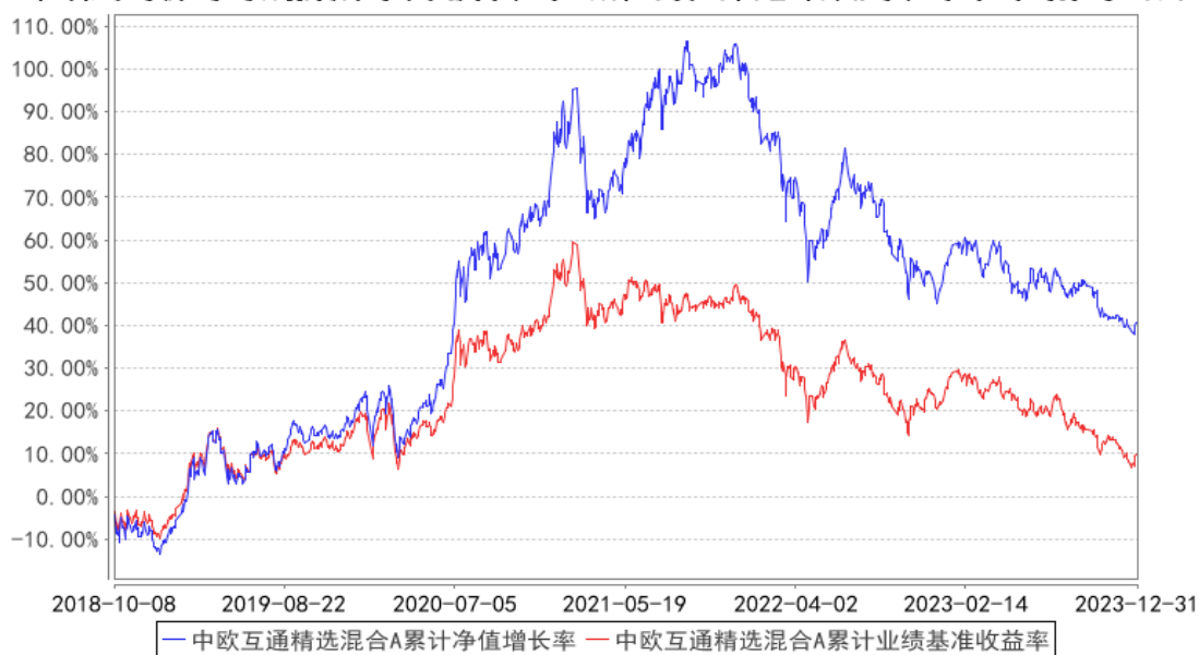
中欧互通精选混合A累计净值增长率与同期业绩比较基准收益率的历史走势对比图

注：自 2018 年 10 月 8 日起，原中欧沪深 300 指数增强型证券投资基金转型为中欧互通精选混合型证券投资基金。图示为 2018 年 10 月 8 日至 2023 年 12 月 31 日。