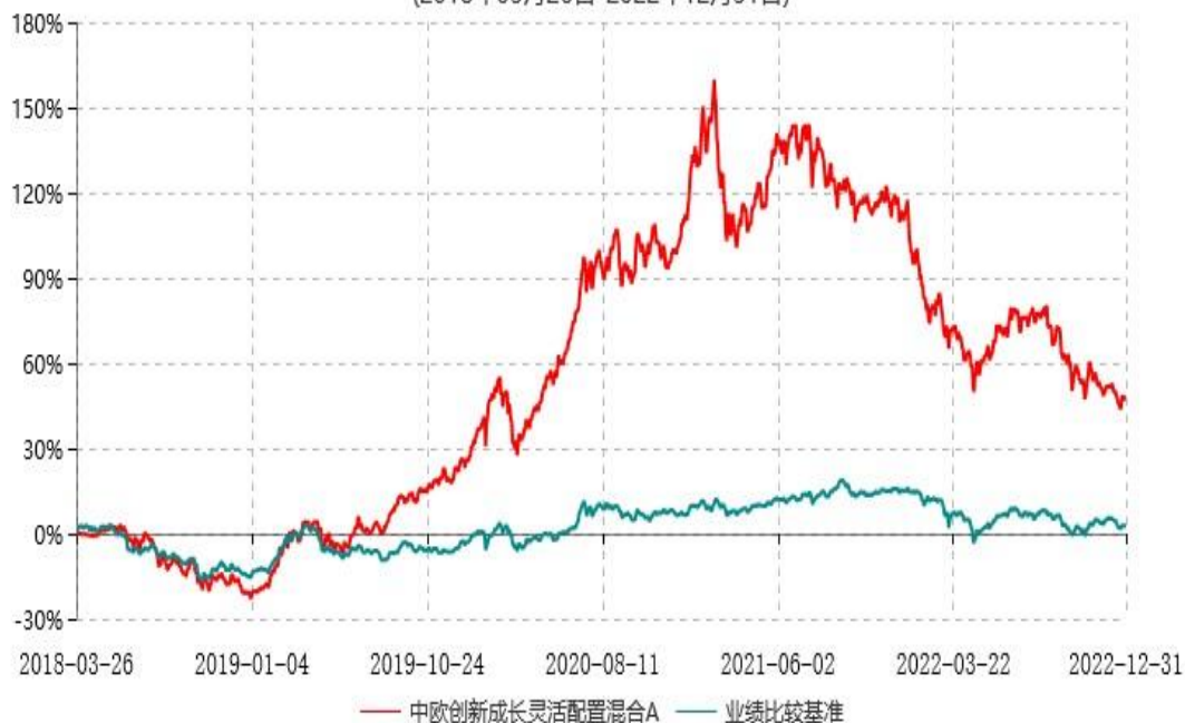
中欧创新成长灵活配置混合C累计净值增长率与业绩比较基准收益率历史走势对比图