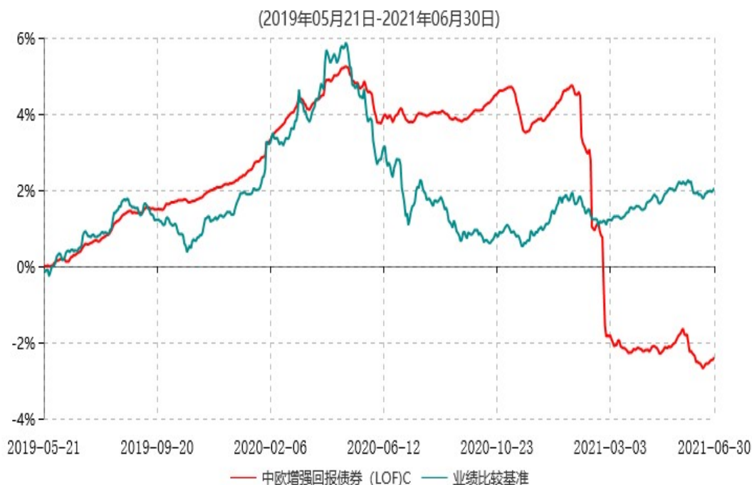
中欧增强回报债券 (LOF)C 累计净值增长率与业绩比较基准收益率历史走势对比图

注：本基金于 2019 年 5 月 20 日新增 C 份额，图示日期为 2019 年 5 月 21 日至 2021 年 6 月 30 日。