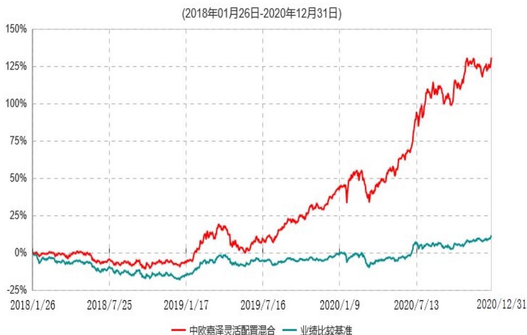
中欧嘉泽灵活配置混合型证券投资基金累计净值增长率与业绩比较基准收益率历史走势对比图