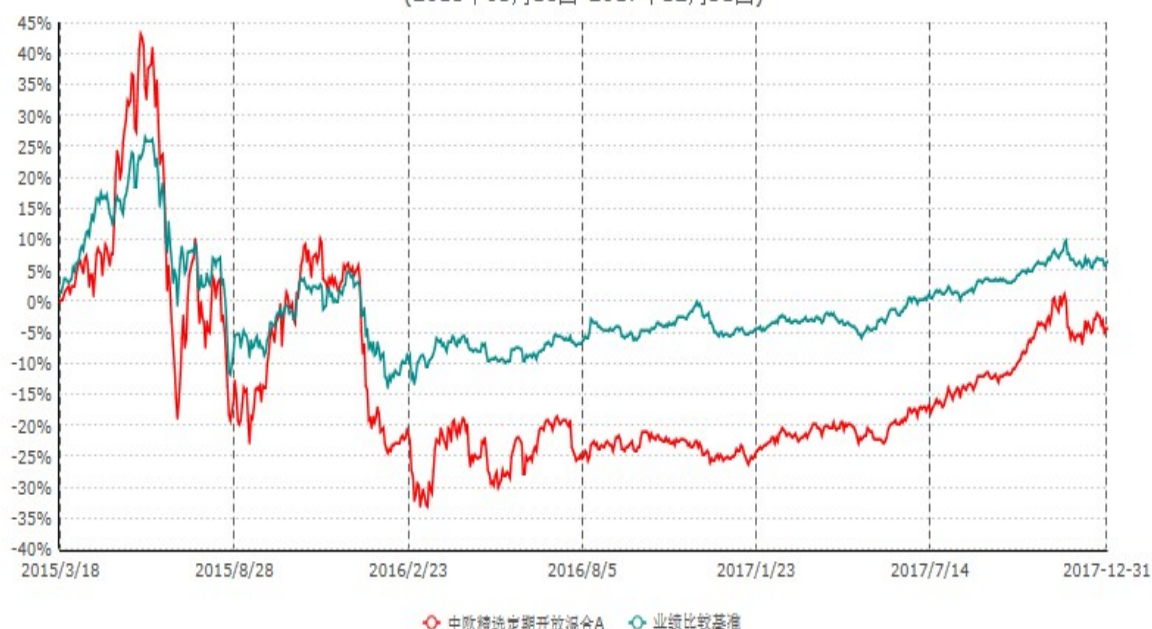
中欧精选定期开放混合A累计净值增长率与业绩比较基准收益率历史走势对比图 (2015年03月18日-2017年12月31日)