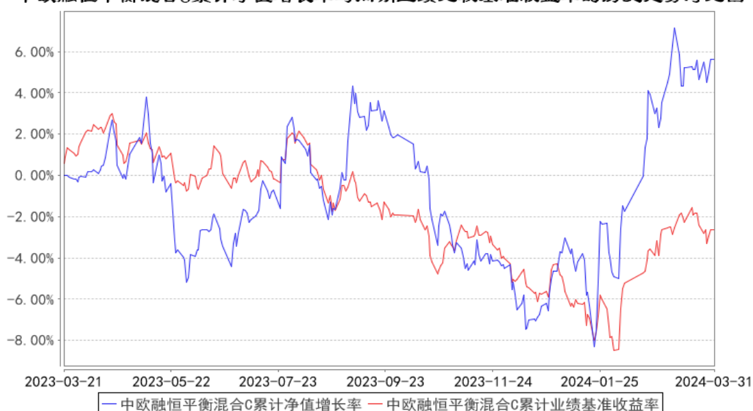
中欧融恒平衡混合C累计净值增长率与同期业绩比较基准收益率的历史走势对比图

注：本基金基金合同生效日期为 2023 年 3 月 21 日，按基金合同的规定，本基金自基金合同生效起六个月为建仓期，建仓期结束时各项资产配置比例已经符合基金合同约定。