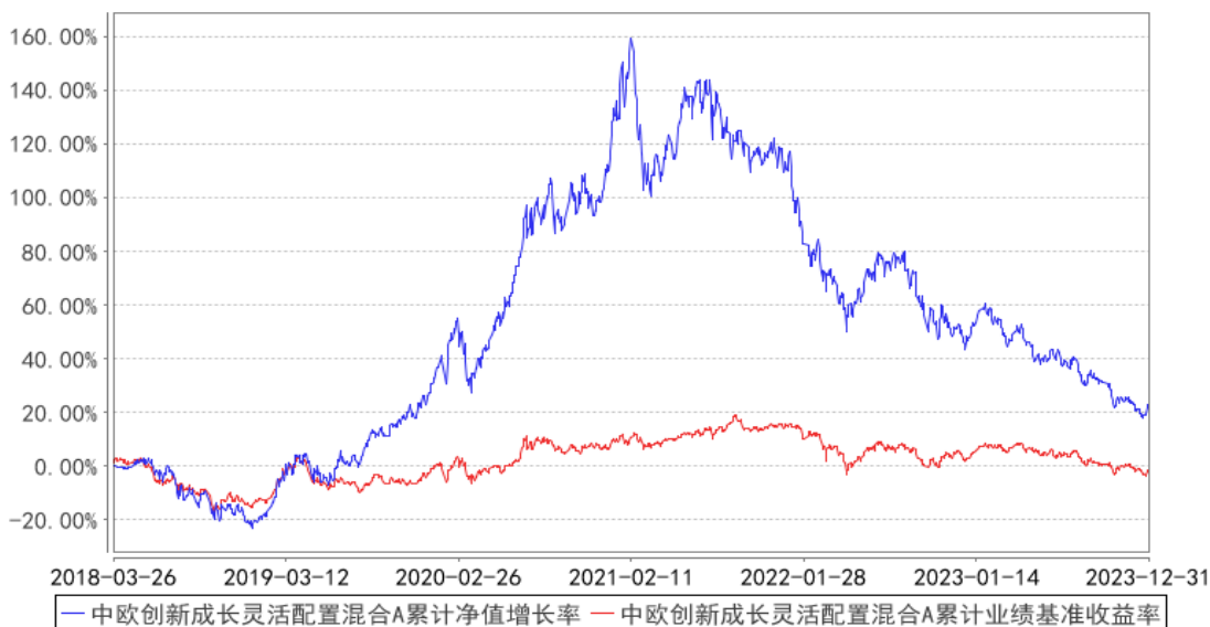
中欧创新成长灵活配置混合A累计净值增长率与同期业绩比较基准收益率的历史走势对比图