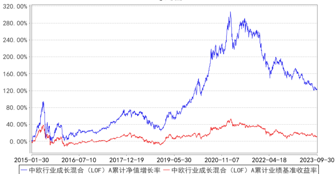
中欧行业成长混合 (LOF) A 累计净值增长率与同期业绩比较基准收益率的历史走势对比图