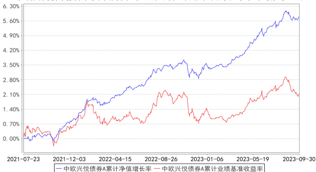
中欧兴悦债券A累计净值增长率与同期业绩比较基准收益率的历史走势对比图