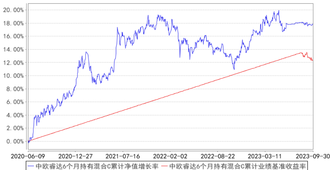
中欧睿达6个月持有混合C累计净值增长率与同期业绩比较基准收益率的历史走势对比图

注：2023年8月14日起组合业绩比较基准变更为中债综合财富(总值)指数收益率*80%+沪深300指数收益率*17%+中证港股通综合指数(人民币)收益率*3%。本基金于2020年6月5日新增C份额，图示日期为2020年6月9日至2023年09月30日。