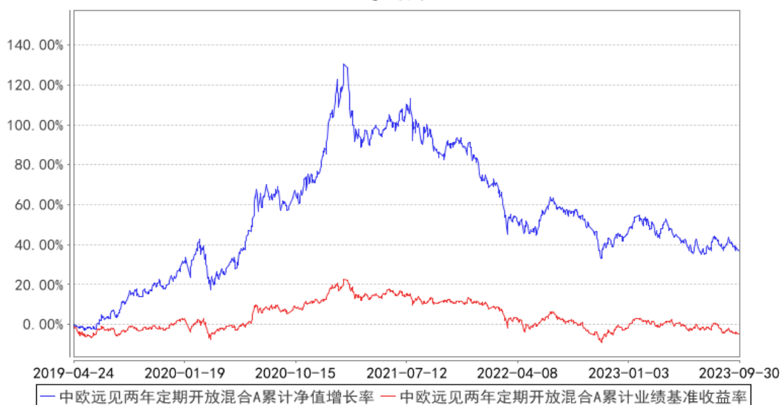
中欧远见两年定期开放混合A累计净值增长率与同期业绩比较基准收益率的历史走势对比图