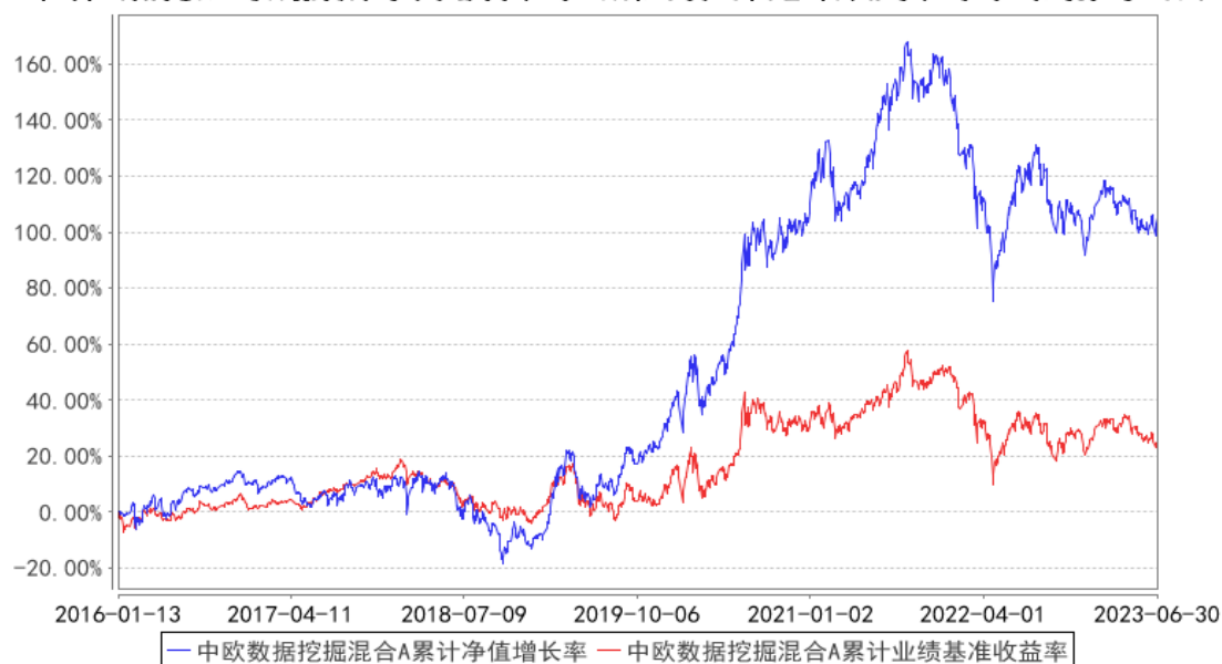
中欧数据挖掘混合A累计净值增长率与同期业绩比较基准收益率的历史走势对比图

注：“2019 年 4 月 26 日组合业绩比较基准变更为中证 500 指数收益率*95%+中债综合指数收益率*5%。”