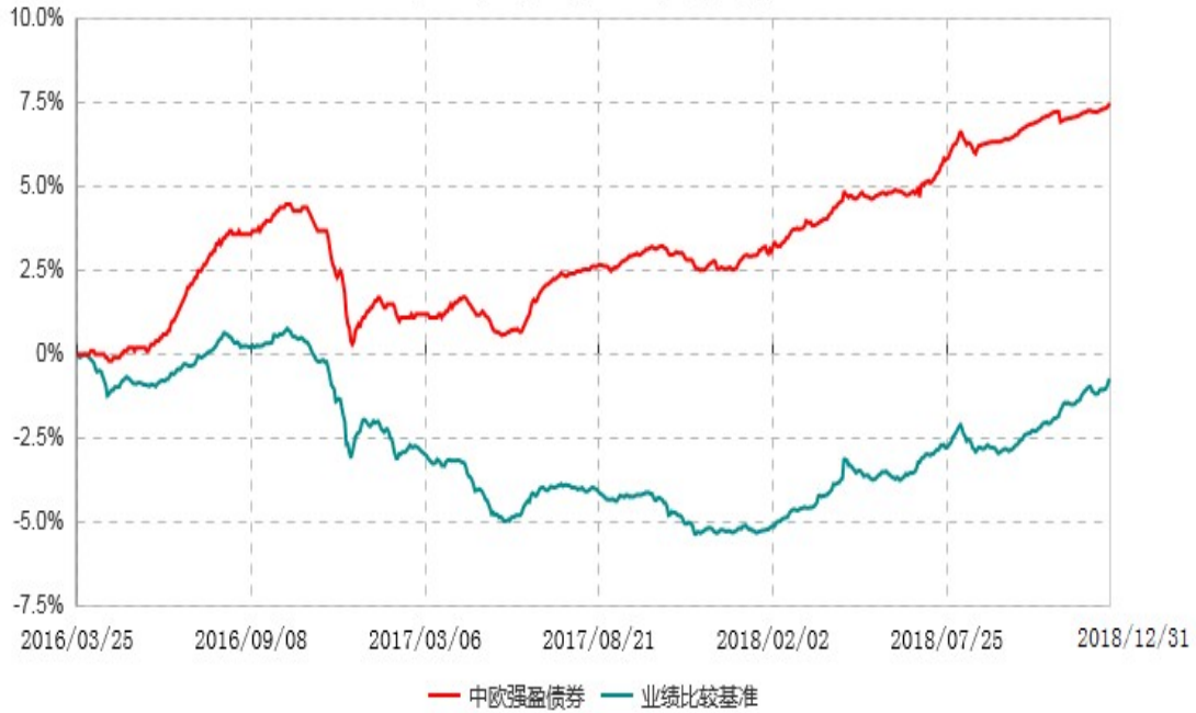
中欧强盈定期开放债券型证券投资基金累计净值增长率与业绩比较基准收益率历史走势对比图 (2016年03月25日-2018年12月31日)