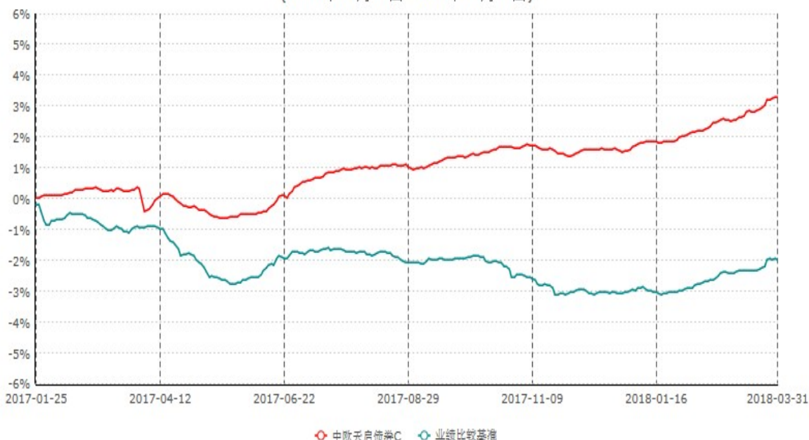
中欧天启债券C累计净值增长率与业绩比较基准收益率历史走势对比图 (2017年01月25日-2018年03月31日)

注：本基金基金合同生效日期为 2017 年 1 月 25 日，按基金合同的规定，本基金自基金合同生效起六个月为建仓期，建仓期结束时各项资产配置比例已达到基金合同约定。