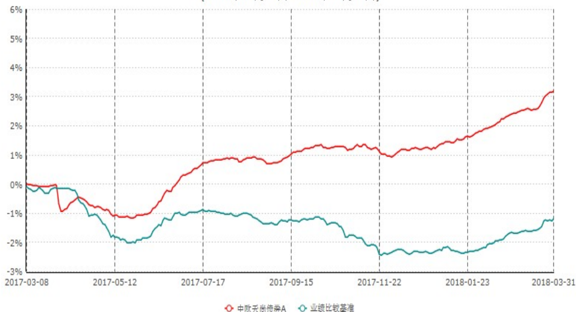
中欧天尚债券A累计净值增长率与业绩比较基准收益率历史走势对比图 (2017年03月08日-2018年03月31日)

注：本基金基金合同生效日期为 2017 年 3 月 8 日，按基金合同的规定，本基金自基金合同生效起六个月为建仓期，建仓期结束时各项资产配置比例已达成基金合同约定。