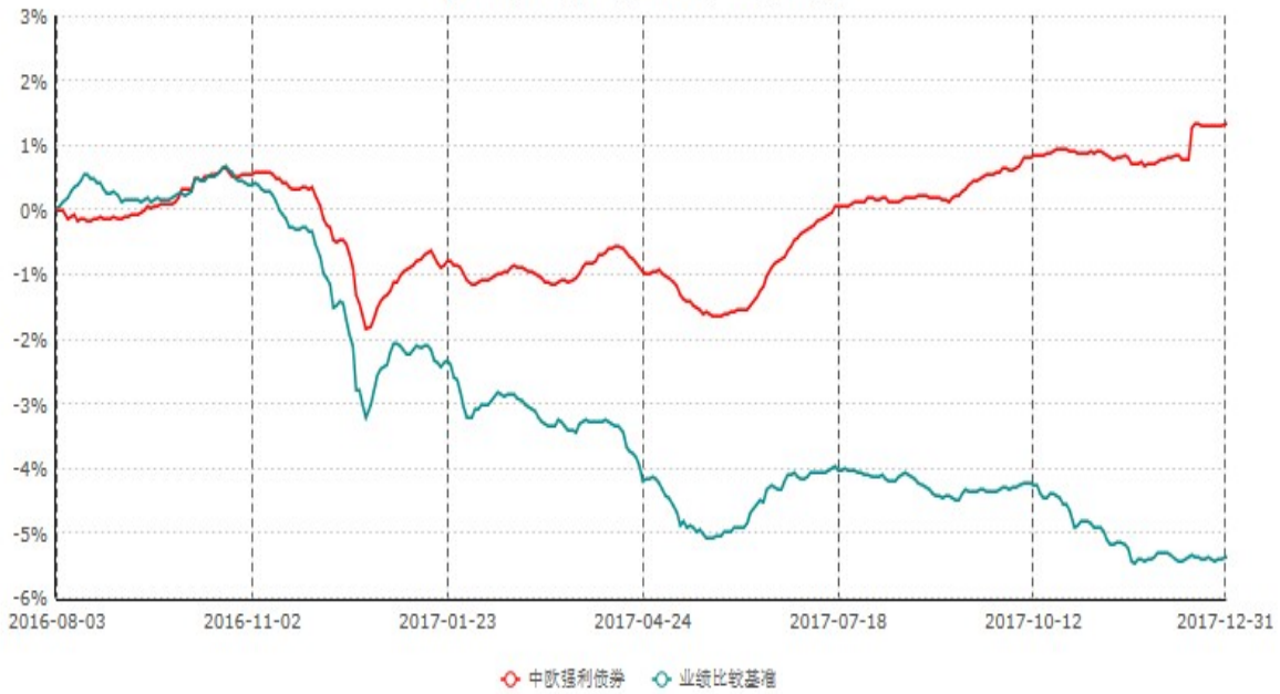
中欧强利债券型证券投资基金累计净值增长率与业绩比较基准收益率历史走势对比图 (2016年08月03日-2017年12月31日)

注：本基金基金合同生效日期为2016年8月3日，按基金合同的规定，本基金自基金合同生效起六个月为建仓期，建仓期结束时本基金的各项资产配置比例已达到基金合同的规定。